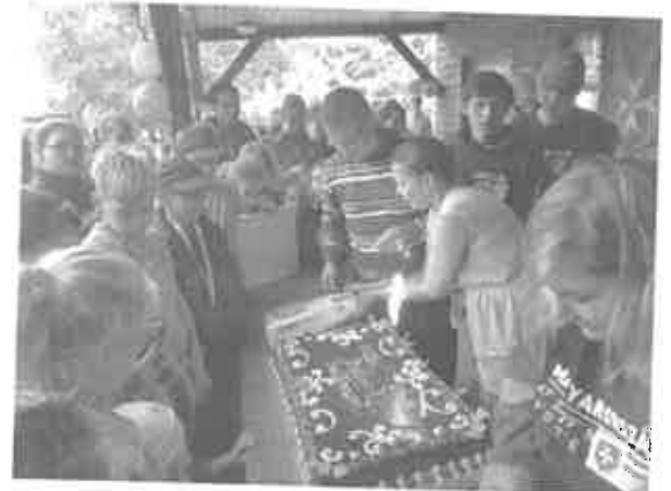
24. 2. szilveszter