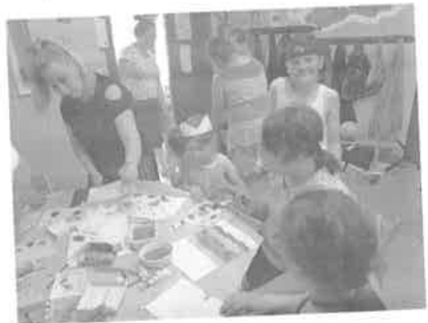
10. anyák napi kézzel készített