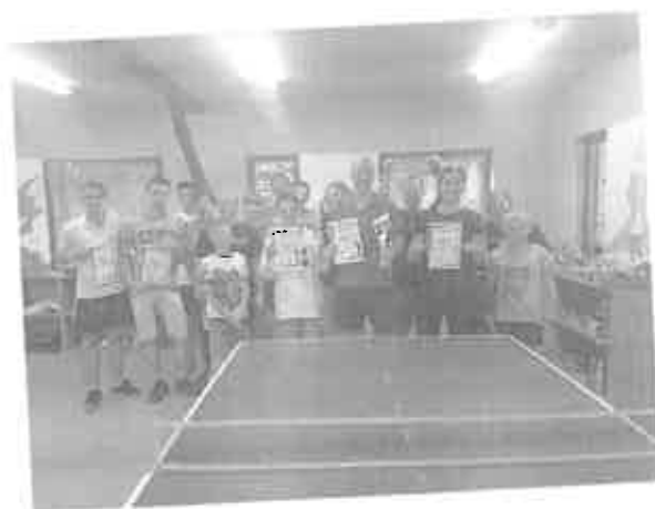
23. Pingpong verseny