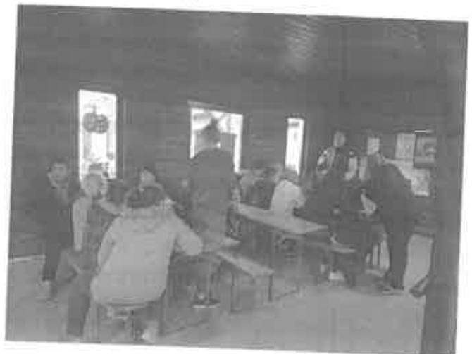
31. Egészségtudatosság- kvíz