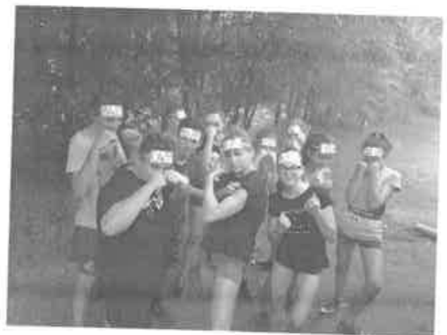
16. Kőgyári tó