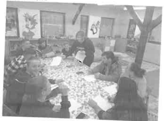
28. Környezettudatosság- kvíz