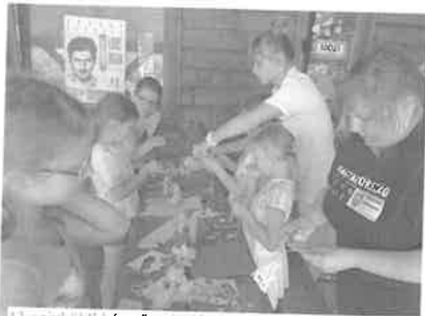
13. szivkúti kézműveskedés