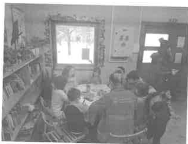
3. kézműves foglalkozás