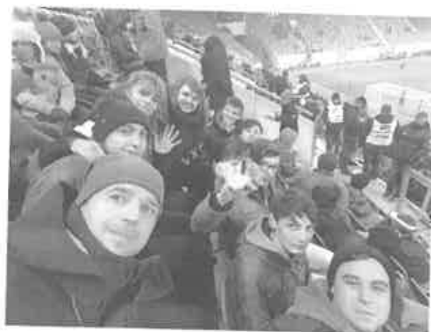
6. Magyarországi - Kiszabottán