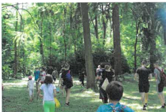
15. Szarvasi arborétum