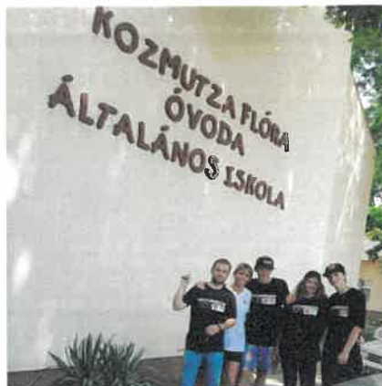
14. Csongrádi önkénteskedés