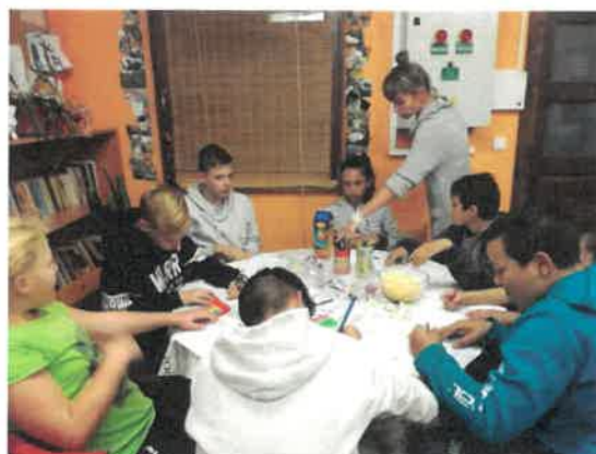
26. Madáretető készítés