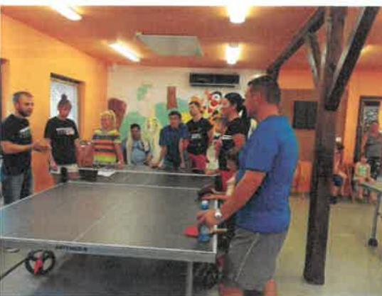
23. Pingpong verseny