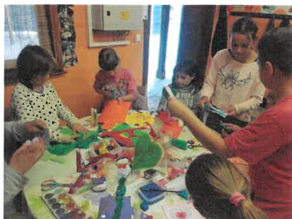
11. Anyák napi kézműves