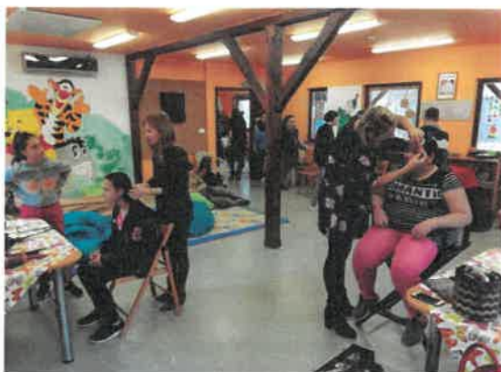
7. Szépség nap