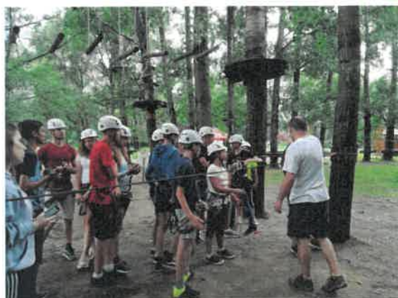
17. Makó kalandpark