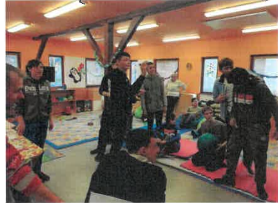
6. Téli Olimpia

Magyar Máltai Szeretetszolgálat Dél-Alföldi Régió